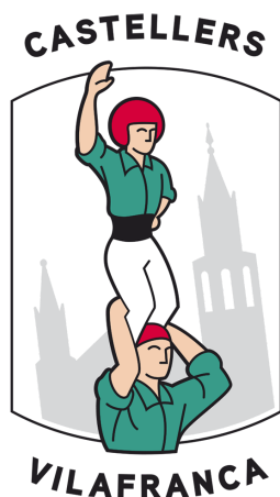
Vilafranca del Penedès

Amb aquest comunicat conjunt, els Castellers de Vilafranca i la Colla Vella dels Xiquets de Valls, unim pensaments i criteris tot reiterant el nostre compromís de treballar plegats per al bé col·lectiu del món casteller.